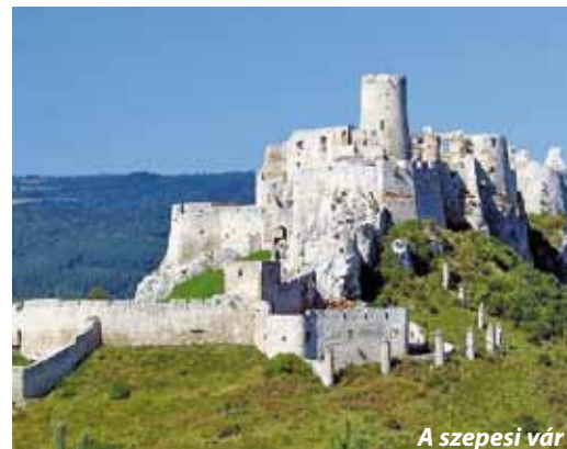
A szepesi vár

Reggeli után városnéző séta, Kassa leghíresebb látványainak felkeresésével: (Szt. Erzsébet székesegyház, Rákóczi fejedelem sírja, Szt. Mihály kápolna, Orbán torony, Főtér, Márai Sándor lakóháza). Utána Eperjesre érünk, ahol a „Tarca parti Athén” műemlékileg védett városmagját tekintjük meg (a főtér pártázatos házsora, Szt. Miklós templom, Rákóczi ház). Észak felé vezető utunkat az UNESCO Világörökségéhez tartozó Bártfán fejezzük be (Szt. Egyed templom, városháza, ortodox templom,